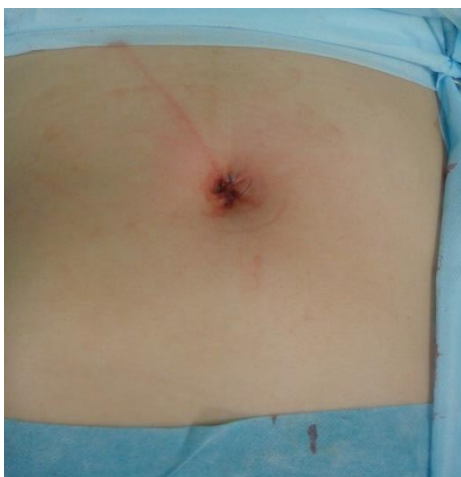
Рис.2. Пациентка Р. После операции.