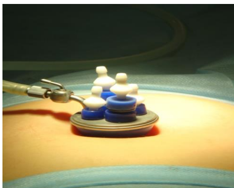
Рис. 1. Установка порта.