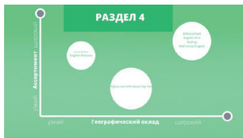
Рис 1. Карта стратегических групп для проекта «Incentive»

Построенная карта стратегических групп для онлайн проекта представлена ниже (рис. 1)