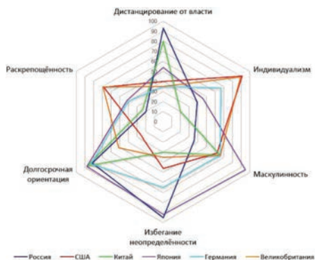
Рис.1. Модель Хофстеде

Используя информацию, полученную из факторного анализа, Хофстеде описывает влияние культуры общества на индивидуальные ценности своих членов. Типология основана на предположении о том, что ценность может быть распределена по шести измерениям культуры. К этим измерениям относятся: дистанцирование от власти, индивидуализм, маскулинность, избегание неопределённости, долгосрочная ориентация, раскрепощённость.