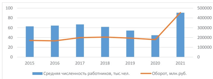
Рисунок 2. Отдельные показатели развития малого предпринимательства в Калининградской области

Кроме того, оборот предприятий по сравнению с предыдущим годом вырос на 155 %, что говорит об увеличении доли предприятий малого бизнеса в секторе экономики области (см.рис.2)